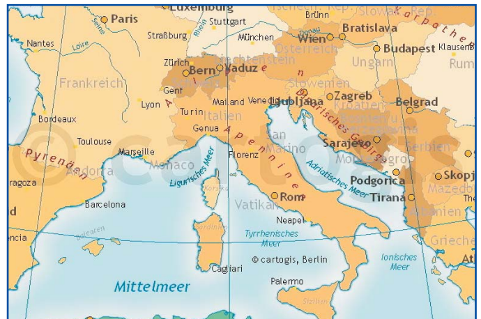
Ausschnitt 250 % vergrößert

Hinweis: das Wasserzeichen ist in den Endprodukten selbstverständlich nicht enthalten.