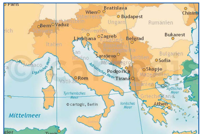
Ausschnitt 250 % vergrößert

Hinweis: das Wasserzeichen ist in den Endprodukten selbstverständlich nicht enthalten.