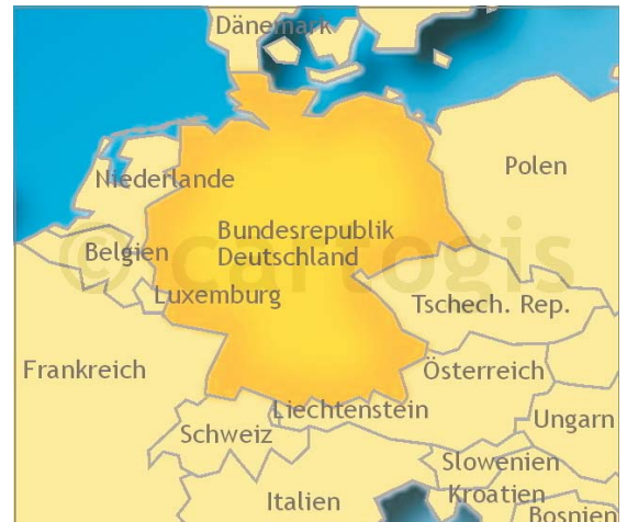
Ausschnitt 700 % vergrößert

Hinweis: das Wasserzeichen ist in den Endprodukten selbstverständlich nicht enthalten.